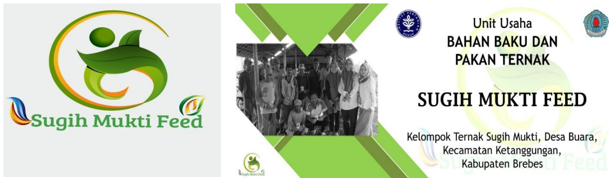
Gambar 3. Logo Unit Usaha Sugih Mukti Feed

adanya logo unit usaha sebagai identitas usaha. Logo unit usaha sugih mukti feed disajikan pada Gambar 3.